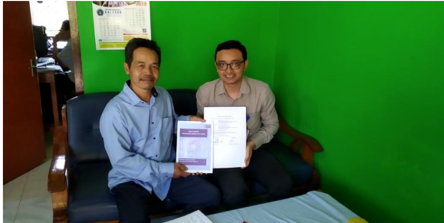
Gambar 6. Acara serah terima website SD Negeri Tajem

Setelah dilakukan pelatihan dan pendampingan penggunaan website www.sdntajem.com kepada dua orang guru sekaligus staff IT, kami juga melakukan serah terima hasil dari pengabdian masyarakat ini kepada kepala sekolah SD Negeri Tajem. Gambar 6 merupakan acara serah terima hasil pengabdian masyarakat berupa website www.sdntajem.com beserta modul penggunaan website tersebut.