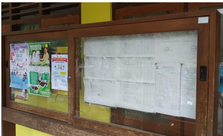
Gambar 1. Kondisi dan letak papan pengumuman SD Negeri Tajem

Oleh karena itu pihak sekolah selaku mitra kami menginginkan adanya pembuatan sebuah website SD Negeri Tajem untuk meningkatkan efektifitas dalam penyampaian informasi kepada para orang tua maupun wali murid. Pihak sekolah juga menyampaikan bahwa dengan adanya website tersebut akan memudahkan sharing materi pelajaran kepada para siswa untuk penunjang dalam belajar di rumah. Selain itu keberadaan website ini nantinya juga dapat menjadi penunjang akreditasi sekolah.