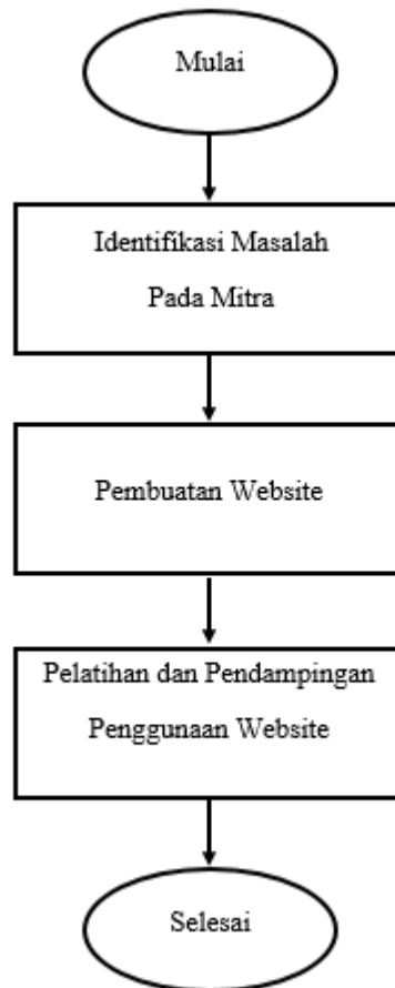
Gambar 2. Alur metode pelaksanaan program pengabdian kepada masyarakat

Program pengabdian kepada masyarakat ini dilaksanakan berdasarkan alur yang ditunjukkan pada Gambar 2 sebagai berikut.