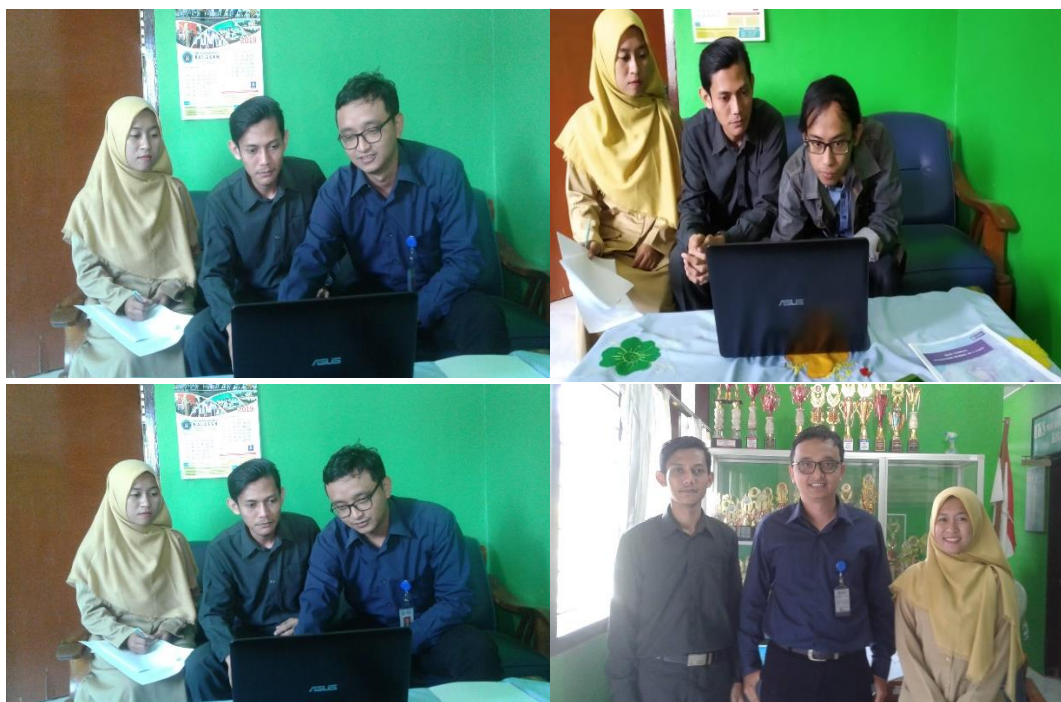
Gambar 5. Pelatihan dan pendampingan penggunaan website kepada guru maupun staff IT SD Negeri Tajem

Pelatihan penggunaan dan manajemen konten website www.sdntajem.com kepada pengelola IT maupun guru bertujuan agar dapat menggunakan website tersebut untuk mengupload informasi yang berupa pengumuman pada website maupun bahan ajar melalui fitur e-learning yang telah tersedia pada website tersebut. Pelatihan dan pendampingan diberikan kepada dua orang guru yang juga bertugas sebagai pengelola IT di SD Negeri Tajem. Gambar 5 merupakan pelatihan dan pendampingan penggunaan website kepada guru maupun staff IT SD Negeri Tajem.