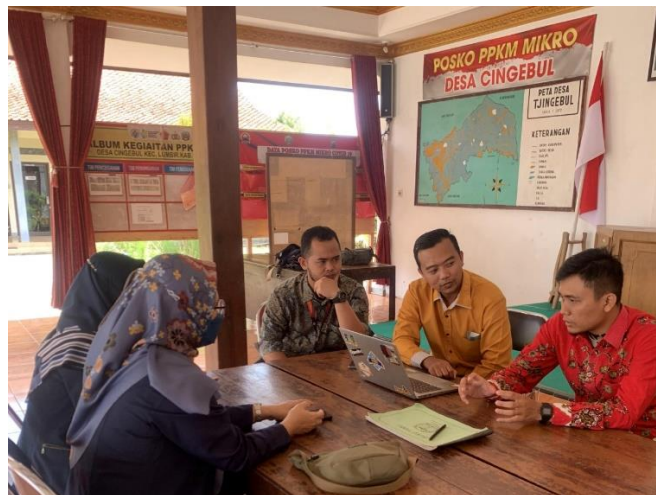
Gambar 1. Rapat Persiapan Pelatihan

Dengan permasalahan – permasalahan yang ada, tim AMM kami menawarkan solusi untuk menyelesaikan masalah tersebut yaitu dengan penerapan Aplikasi Penentuan Prioritas Rencana Kerja Pemerintahan Desa yang telah dibuat dengan menyesuaikan kebutuhan desa. Ada beberapa hak akses pada aplikasi tersebut yaitu super admin, admin, admin RT, admin RW, dan user.