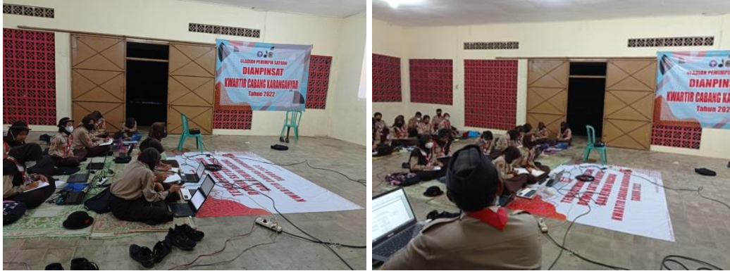
Gambar 2. Dokumentasi Kegiatan Pelatihan

Pelaksanaan kegiatan dihari kedua adalah sesi praktik, yakni praktik fotografi, penulisan teks, dan pembuatan media sosial Instagram. Pada kegiatan praktik fotografi, para peserta diberikan bekal tentang fotografi jurnalistik yang berisi tentang tipe-tipe fotografi jurnalistik, prinsip fotografi jurnalistik, dan etika fotografi jurnalistik. Pada prinsipnya, fotografi jurnalistik merupakan sebuah rangkaian foto yang bercerita yang akan menyampaikan sebuah peristiwa ataupun kejadian kepada khalayak (Haqqu et al., 2020).