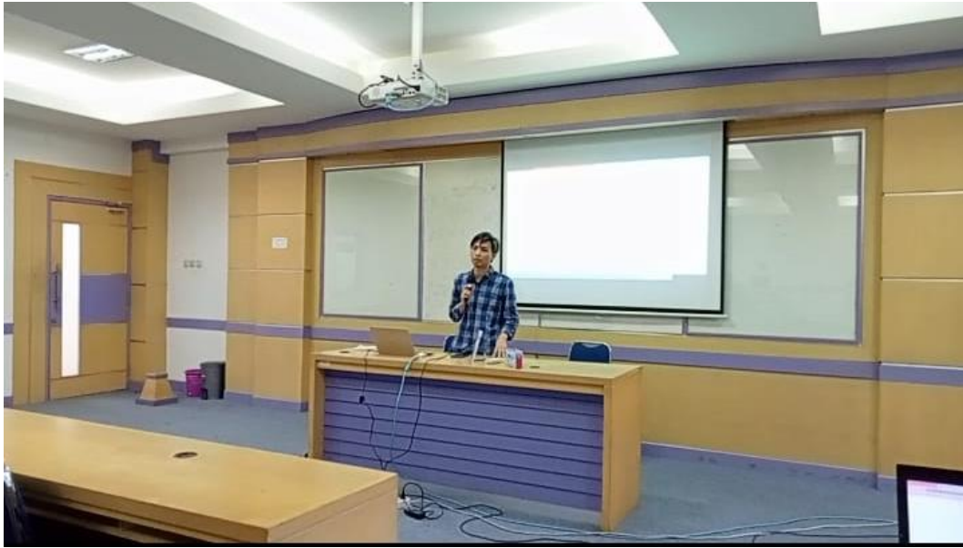
Gambar 2. Pemateri Menyampaikan Materi Pelatihan