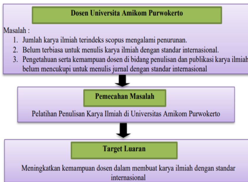
Gambar 1. Skema Masalah, Solusi dan Target Luaran

Metode dan pendekatan yang digunakan dalam kegiatan pengabdian untuk menyelesaikan permasalahan yang ada adalah dengan ceramah atau presentasi, diskusi dan studi kasus. Gabungan metode tersebut diharapkan mampu meningkatkan kemampuan dosen dalam membuat karya ilmiah dengan standar internasional.