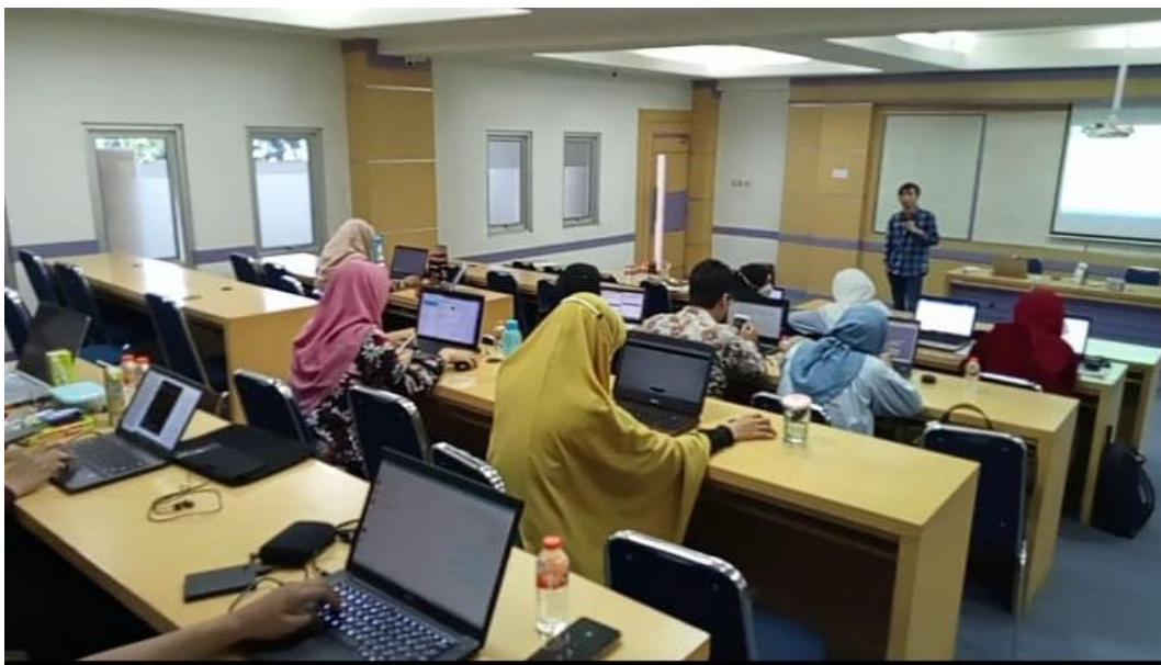
Gambar 3. Pelaksanaan Kegiatan Pelatihan

Sebelum kegiatan diakhiri dilakukan sesi tanya jawab, peserta diberi kesempatan untuk menanyakan yang belum dipahami. selanjutnya kegiatan akhir pada pelatihan ini dilakukan evaluasi dengan cara memberikan pertanyaan terhadap peserta dan mengisi kuesioner untuk mengukur pemahaman terhadap materi yang diberikan. Pertanyaan yang diberikan oleh pemateri dapat dijawab oleh peserta