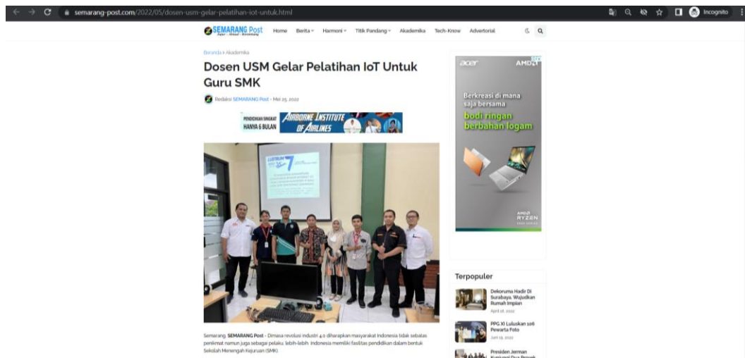
Gambar 1. Publikasi Online di Semarang Post

Peningkatan kemampuan peserta pengabdian diukur dengan melakukan perbandingan hasil pre-test dan post-test. Pre-test akan dilakukan oleh peserta di awal kegiatan sedangkan post-test akan dilakukan pada akhir kegiatan.