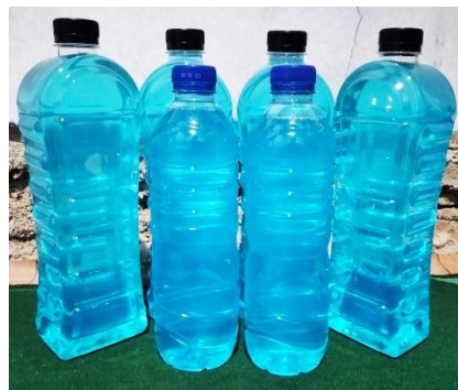
Gambar 5. Pengemasan Deterjen Cair

Setelah proses pembuatan deterjen cair selesai, tahap selanjutnya melakukan pengemasan deterjen cair ke dalam botol.