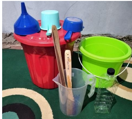
Gambar 2. Peralatan Pemuatan Deterjen Cair

Sedangkan bahan-bahan yang diperlukan dapat dibeli di toko kimia atau dengan membeli bahan yang sudah dalam satu paket untuk pembuatan deterjen cair. Pada pelatihan ini Tim memberi bahan dalam bentuk satu paket yang terdiri dalam tiga kemasan yaitu: