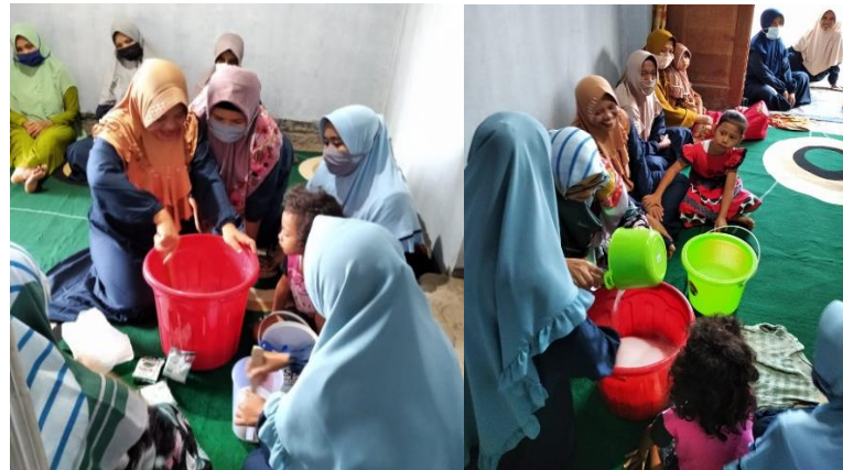
Gambar 4. Proses Pembuatan Deterjen Cair

Setelah proses pembuatan deterjen cair selesai, tahap selanjutnya melakukan pengemasan deterjen cair ke dalam botol.