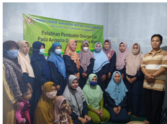
Gambar 6. Foto Bersama Peserta

Setelah dilakukan penutupan kegiatan pada pukul 17.30 WIB dilakukan acara sesi foto bersama dengan anggota dasawisma.