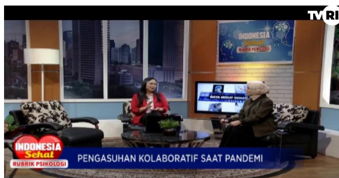
Gambar 1. Program Talkshow Indonesia Sehat Rubrik Psikologi TVRI Nasional Episode Pengasuhan Kolaboratif saat Pandemi

Hadir Tapi Tak Terlihat: Mediatisasi Kesehatan Mental pada Program Televisi Publik Indonesia (A.A.I Prihandari Satvikadewi 1 )