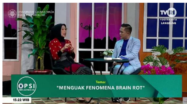
Gambar 3. Program Talkshow OPSI - TVRI Daerah Yogyakarta Episode 'Menguak Fenomena Brain Rot'