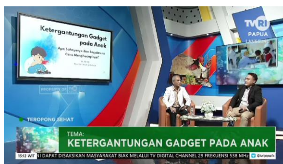
Gambar 4. Program Talkshow Teropong Sehat - TVRI Daerah Yogyakarta Episode 'Ketergantungan Gadget pada Anak'

Keempat program menunjukkan adanya pola teknik produksi yang relatif serupa, meskipun diproduksi oleh unit yang berbeda dan menyasar segmentasi audiens yang berlainan. Tiga dari empat program -Indonesia Sehat Rubrik Psikologi, Woman's Insight, dan OPSI- diawali dengan segmen live music atau musik pembuka sekitar lima menit sebelum memasuki diskusi utama. Pola ini tidak ditemukan pada Teropong Sehat produksi TVRI Papua yang