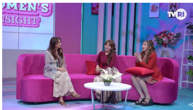
Gambar 2. Program Talkshow Woman Insight TVRI Nasional Episode 'Quarter Life Crisis'