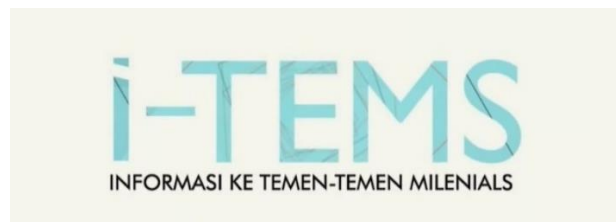
Gambar 1 Logo Program

Pada pembahasan mengenai penelitian ini adalah manajemen produksi program I-Tems di Mata Milenial Indonesia Televisi, agar tercapainya manajemen produksi program yang baik kedepannya, peneliti menggunakan konsep komunikasi massa, media massa, manajemen produksi program televisi, dimana program I-Tems merupakan jenis program feature membahas suatu pokok bahasan yang secara lengkap menyoroti dan mengurai dengan berbagai format dan kreasi dengan tujuan untuk menghibur dan memberikan informasi edukatif sehingga membuat penonton terkesan dan terinspirasi oleh tayangan tersebut.