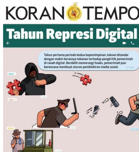
Gambar 2. Cover Tempo Edisi 21 Oktober 2020

menghadang kritik dengan regulasi tertentu. Regulasi ini yang dinilai sangat berpotensi melahirkan tindakan represif dari penegak hukum. Pada akhirnya, implikasi dari regulasi ini dinilai justru membatasi kebebasan berekspresi masyarakat. Meski juga demikian perlu dipahami bersama bahwa kebebasan berekspresi perlu selaras dengan tanggung jawab sosial masyarakat dalam membangun iklim komunikasi melalui media digital yang harmonis. Gambaran lebih jauh mengenai hal tersebut bisa dilihat dari cover berikut ini: