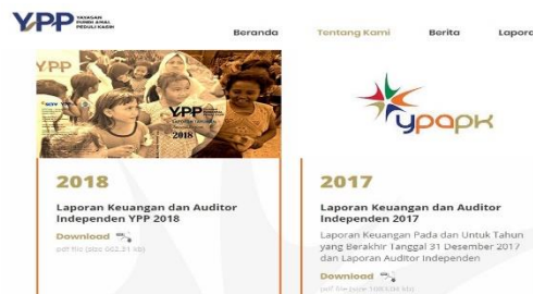
Gambar 2 Unggahan Website www.ypp.co.id

Berikut dibawah ini salah satu contoh dari Laporan Keuangan Yayasan Pundi Amal Peduli Kasih Yang telah dilakukan Audit oleh Auditor Internal dan Eksternal