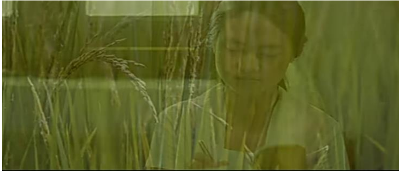
Gambar 9. Scene 7 (05.15 - 05.19)