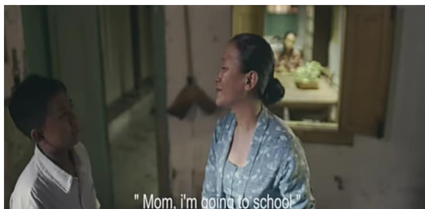
Gambar 3. Scene 3 (02.12 - 02.57)