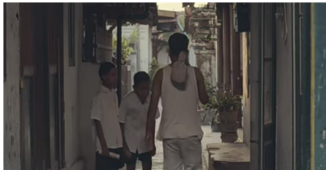
Gambar 5. Scene 4 (02.58 - 03.08)