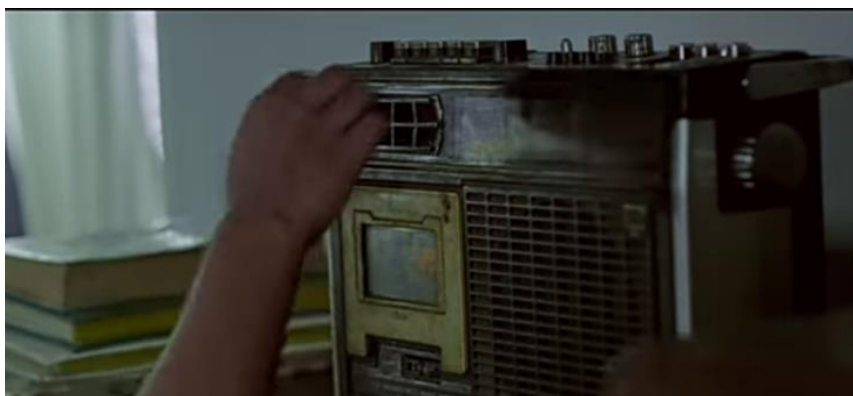
Gambar 8. Scene 6 (04.37- 05. 14)