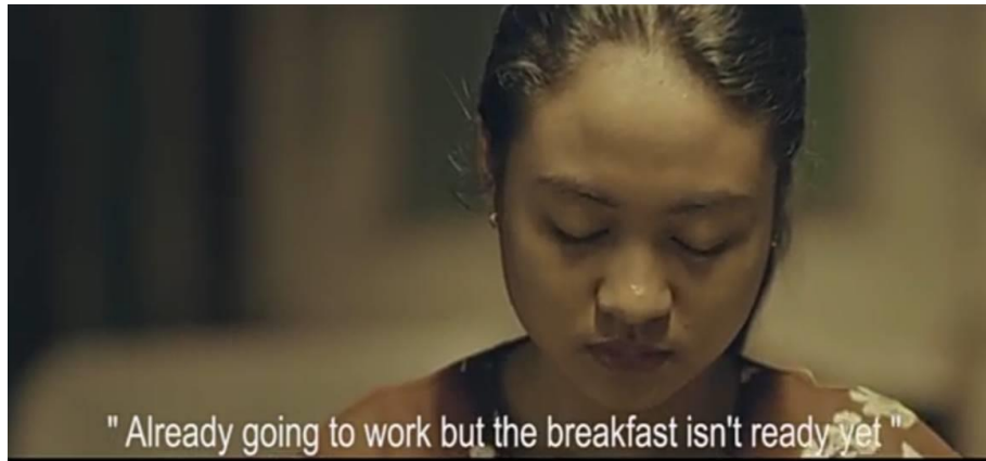
Gambar 2. Scene 2 ( 01.27 - 02.10)