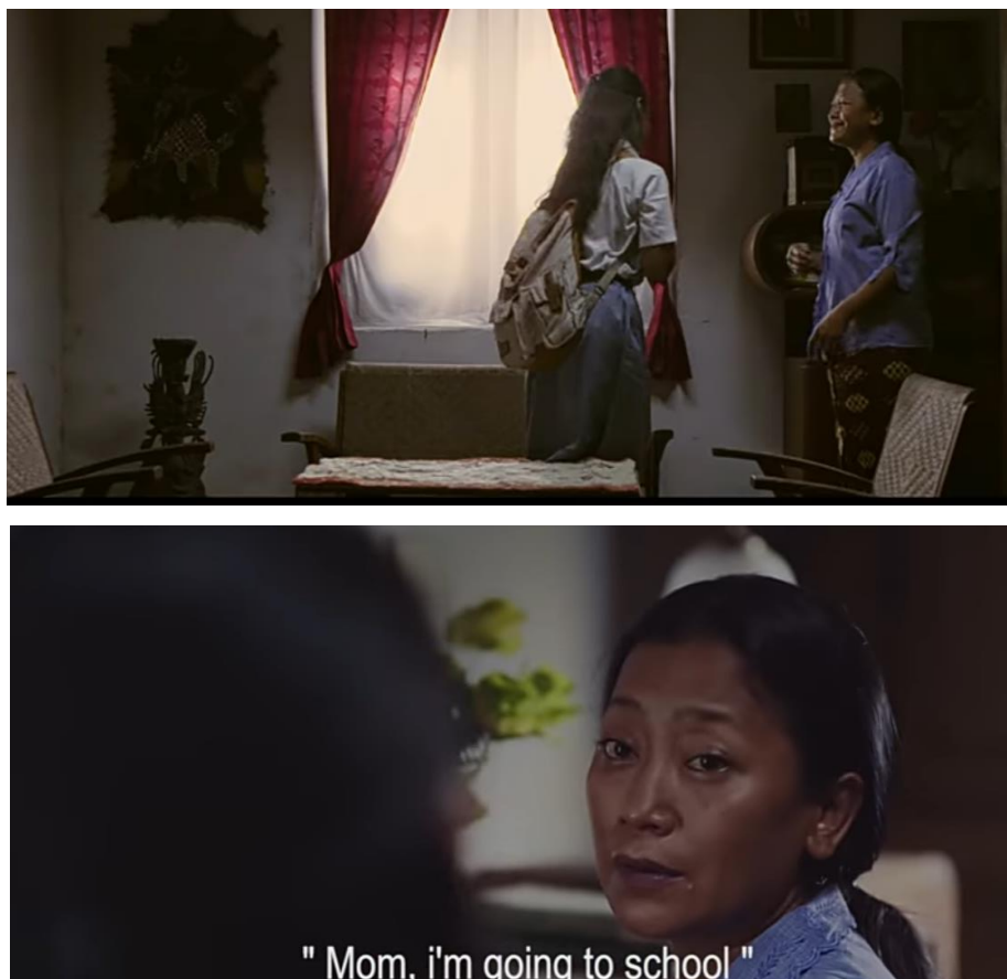
Gambar 12 dan 13. Scene 10 (06.29- 07. 01)