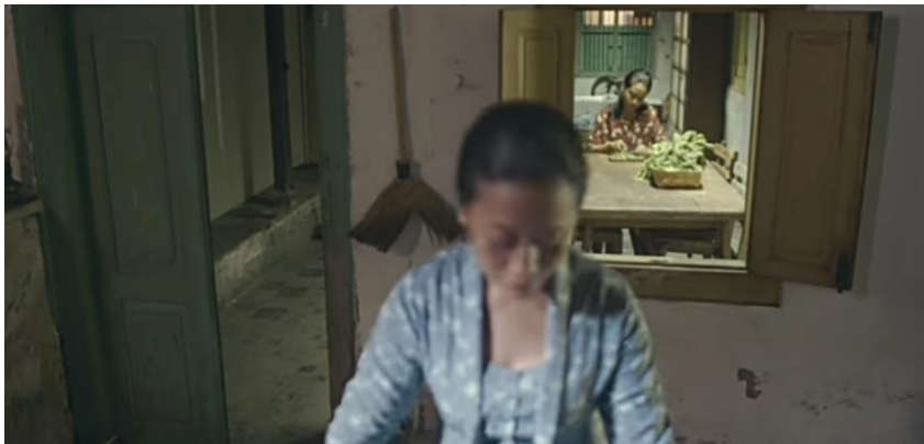
Gambar 4. Scene 3 (02.49 - 02.57)