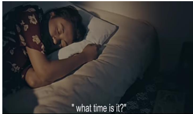
Gambar 1. Scene 1 ( 00. 26 - 00.53)